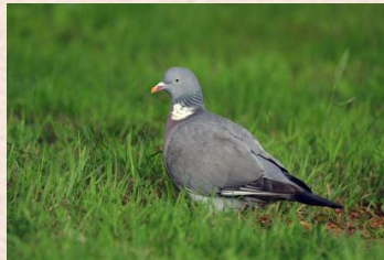
Duva, Skogs-/Duva, Ring-