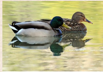
Gråand / Mallard